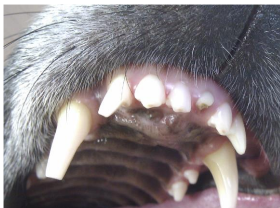
Fraktur des wurzelbehandelten 101