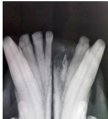
Wurzelrest des 2. Schneidezahnes sichtbar. 1. Inzisivus fehlt komplett