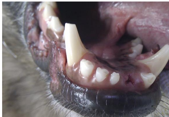
Verlust von 2 Schneidezähnen im UK